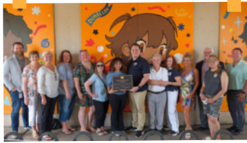
"BRIGHT DAY, EVERY DAY" MURAL INSTALLATION AT THE MADISON AVENUE UNDERPASS