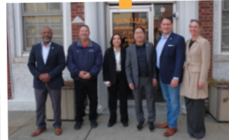
US SENATOR ANDY KIM VISITS DUNELLEN