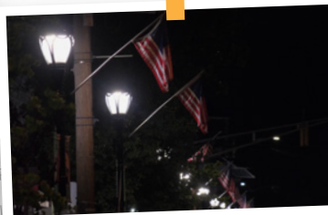
NEW LED LIGHTING ALONG NORTH AVENUE

Incorporated 1887 | 8,411 population 2,725 housing units | Median age: 41.7 Median income $84,789 | 1,371 School children: 640 in elementary, 331 in middle & 400 in high school 13% of population is senior citizens 63% of housing is owner-occupied 37% of housing is renter-occupied 3.36 average family size